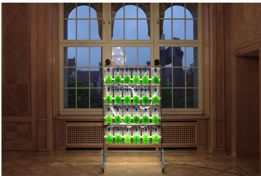
Marek Wodzisławski, Biowitraż – algi haematococcus pluvialis, zestaw grawitacyjny do żywienia dojelitowego, z cyklu „Umgebung”, 2024, 2 x 1,5 m, fot. Marek Wodzisławski, widok z wystawy w CK Zamek, Poznań, 2024

Wodzisławski w podobnym duchu dowartościowuje estetyczny wymiar istnienia organizmów nie-ludzkich, upatrując w nim istoty ich wpływu na rzeczywistość. W szeregu prac artysta eksploruje szczególnie rodzaj takiej sprawczości, podejmując refleksję nad statusem twórczości artystycznej i przełamując konwencjonalne postrzeganie sztuki wyłącznie jako domeny działalności człowieka. Podobnie jak estetyka, w tym ujęciu sztuka nie jest jedynie warstwą „lukru”, lecz elementem fundamentalnych mechanizmów kształtujących rzeczywistość. Artysta zdaje się poszukiwać odpowiedzi na postawione przez Mortona pytanie: Dlaczego tylko ludzie mieliby tworzyć sztukę? 20 Jedną ze stosowanych przez Wodzisławskiego strategii jest inicjowanie w przestrzeni galeryjnej naturalnych procesów realizowanych przez nie-ludzi oraz wpisywanie ich w konwencjonalne tropy, motywy i schematy znane z kultury, sztuki i ikonografii. Gesty te problematyzują płynność naturokulturowych granic. Przykładem jest pokazany na wystawie w CK Zamek „biowitraż”, którego barwne płaszczyzny wytwarzają żywe organizmy – algi. Kultura Haematococcus pluvialis hodowana jest w instalacji zbudowanej z worków do odżywiania dojelitowego, których prostokąty ramują soczystą zieleń alg niczym szprosy. Dzięki napowietrzaczom organizmy nie osiadają, a ciągła cyrkulacja sprzyja ich rozmnażaniu – całość została wyhodowana z niewielkiej ilości.