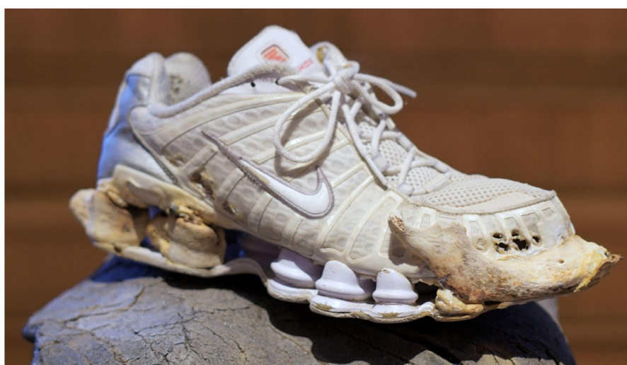
Marek Wodzislowski, Obiekt bioniczny – Nike Shox z platformą z ludzkich kości, asfalt, z cyklu „Umgebung”, 2024, 40 x 30 cm, fot. Marek Wodzislowski, widok z wystawy w CK Zamek, Poznań, 2024

Na tej samej wystawie, w serii animacji stworzonych techniką fotogrametrii, artysta zaprezentował na modelkach i modelach znalezione na wysypiskach resztki odzieży. Fotogrametria to technika rekonstrukcji obiektów 3D z wielu zdjęć 2D, pozwalająca na precyzyjne odwzorowanie geometrii i tekstury. Jej użycie sprawiło, że ukazane figury stały się bardziej odrealnione niż w zwykłym zapisie filmowym. Poprzez swoją „wirtualność”, zaczęły przypominać hipotetyczne postaci z odległej przyszłości – wyobrażonych łowców i zbieraczy ze świata „po katastrofie”, w którym wobec braku surowców naturalnych jedynym dostępnym zasobem stały się syntetyczne odpady. Jeszcze dalej w przyszłość zdawał się sięgać artysta konstruując pokazany na tej samej wystawie but do biegania, w którym w rozbudowany system amortyzacyjny podeszwy wpasowany został precyzyjnie fragment ludzkiej kości. Tę cielesno-syntetyczną hybrydę potraktować można jako zwiastun głębokiej przyszłości, w której rozpoczęte w antropocenie procesy przenikania się materii naturalnej i sztucznej osiągną zaawansowane stadium.