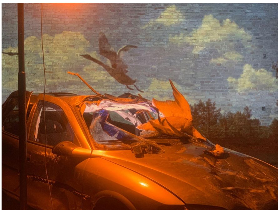
Marek Wodziszławski, Falling – imitacja katastrofy – wypreparowane szczątki łabędzia, wrak samochodu, projekcja, światło stroboskopowe, z cyklu „Körperreise”, 2019, 5 x 5 m, widok z wystawy w Zbrojowni Sztuki w Gdańsku, Gdańsk, 2019

Na wystawie Körperreise w Zbrojowni Sztuki w Gdańsku w 2019 roku 23 Wodziszławski ponownie