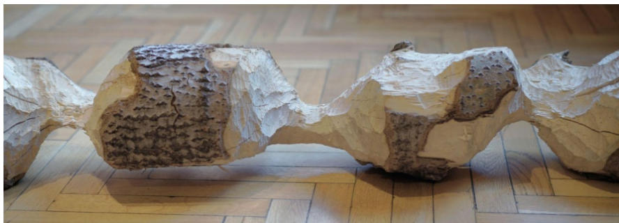
Marek Wodzisławski, Rzeźba zoogeniczna – pień drzewa ogryziony przez bobra, z cyklu „Umgebung”, 2024, 3 m, fot. Marek Wodzisławski, widok z wystawy w CK Zamek, Poznań, 2024