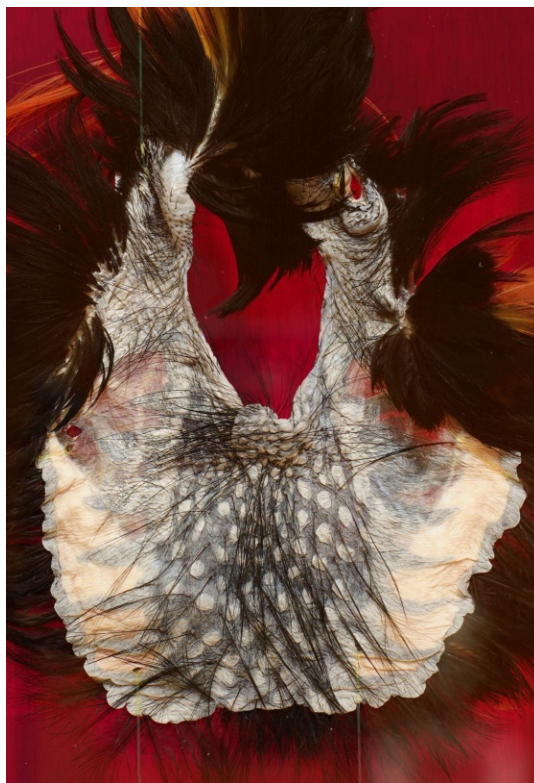
Marek Wodzisławski, Preparat – fałd skórny tragopana, z cyklu „Umgebung”, 2024, 15 x 25 x 5 cm, fot. Marek Wodzisławski, widok z wystawy w CK Zamek, Poznań, 2024

Innym przejawem ubarwienia godowego, który interesuje Wodzisławskiego – jest pawi ogon. Twór ten jeszcze bardziej uwydatnia międzygatunkowy charakter oddziaływań estetycznych. Funkcjonuje bowiem nie tylko wśród samych paw jako ornament płciowy mający przyciągać samice, lecz obrósł także symbolicznymi znaczeniami w świecie ludzi. Ze względu na swoje piękno i okazałość, pawi ogon symbolizuje majestat, elegancję i wyrefinowanie, a w wielu kulturach paw uważany jest za ptaka królewskiego. Z drugiej strony, stanowi też symbol homoerotyczny, będąc ucieleśnieniem estetycznej wybujałości, która w kulturze gejowskiej pozwala z dumą zaznaczyć odrębność od heteronormy. Wodzisławski uwydatnia ten międzygatunkowy splot estetyczno-erotycznych oddziaływań i symbolicznych znaczeń w fotografii pokazanej na wystawie POV w CSW Zamek Ujazdowski w 2021 roku (kurator: Sergey Shabohin). Na pierwszym planie znajdują się leżące na stole zwłoki pawia z widocznym ozdobnym ogonem. Nad nimi zaś góruje stojąca sylwetka ludzka – nagi mężczyzna z głową poza kadrem eksponuje penisa w stanie wzwodu. W tej i kilku innych realizacjach, w tym w pokazanej jako lightbox fotografii nawiązującej do mitu o Ledzie i łabędziu z 2020 roku, Wodzisławski eksploruje tabu międzygatunkowego erotyzmu.