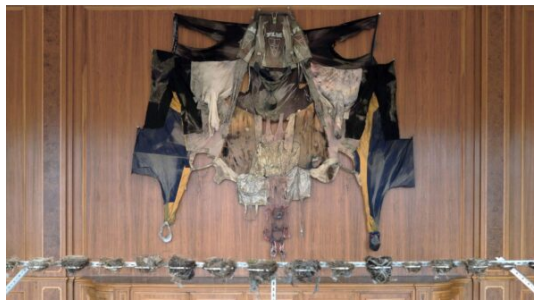
Marek Wodzislowski, Tapiseria – adaptacja odzieży z trzeciego obiegu, z cyklu „Umgebung”, 2024, 5 x 7 m, widok z wystawy w CK Zamek, Poznań, 2024

Długie życie materii syntetycznej i różnorodne formy, jakie może ona przybierać jako odpad, stały się przedmiotem prac powstałych z rzeczy znalezionych na dzikich wysypiskach w okolicach Katowic. Tego rodzaju materia, zwłaszcza jej intrygujące, nietypowe okazy, które artysta wynajduje w takich miejscach i gromadzi, stały się istotnym medium jego twórczości, dołączając w tej funkcji do skupowanych i preparowanych zwłok zwierząt. Perwersyjny dialog z pałacowym wnętrzem CK Zamek podjęła „tapiseria” wykonana z ubrań z wysypiska. Każda sztuka odzieży została przecięta na pół i rozłożona symetrycznie w ramach naściennej kompozycji o dużej skali i regularnym kształcie przywodzącym na myśl herb. Materiały były zdegradowane – w wielu przypadkach z ubrań pozostała jedynie syntetyczna konstrukcja, a organiczne włókna uległy rozkładowi. Odnalezione resztki nosiły ślady odbarwień pod wpływem działania słońca. Kluczowy wpływ na ostateczny kształt i barwę poszczególnych elementów miały procesy naturalne. W ujawnionej strukturze pozostałości odzieży można było także dostrzec analogie biologiczne i specyficzną „tkankowość”.